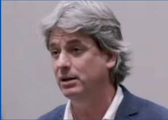
Dionís Guiteras i Rubio Alcalde de Moia (Barcelona)