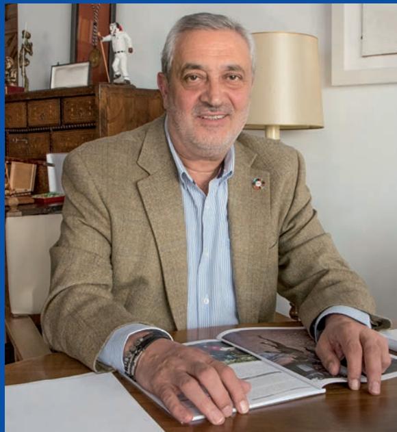
Carlos Carlos Rodríguez Presidente de la Diputación de Cáceres

Miramos al futuro con la ambición que se merecen nuestros municipios, y, en esta línea, hemos diseñado políticas tractoras identificadas por su capacidad de transformación del tejido económico y social. Así, la Diputación ha estructurado sus objetivos en seis grandes agendas: Agenda urbana y rural y lucha contra la despoblación; Infraestructuras y ecosistemas resilientes; Transición energética justa e inclusiva; Una Administración para el siglo XXI; Modernización y digitalización del tejido industrial y de la pyme, recuperación del turismo e impulso a una España nación emprendedora; y Educación y conocimiento, formación continua y desarrollo de capacidades. Seis grandes agendas que incluyen, cada una de ellas, proyectos y planes –casi cincuenta– para vivir en una