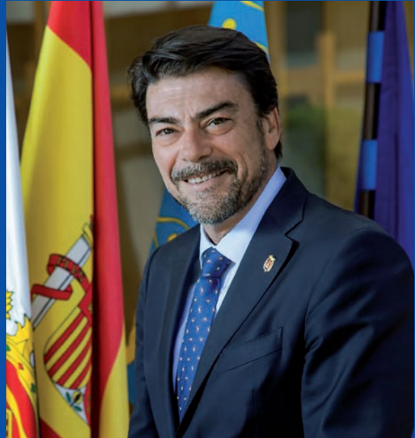
Luis Barcala Alcalde de Alicante

En una primera fase, las partidas más significativas planeadas se destinan al desarrollo del eje metropolitano Alicante-Elche, a la dotación de más suelo industrial y la instalación de nuevos polígonos con mejoras en lo que respecta a la eficiencia energética, y al tratamiento de residuos, movilidad y sostenibilidad. Es primordial y estratégica esa apuesta municipal por la creciente conexión e interacción entre la segunda y tercera ciudades de la Comunidad, que pueden y deben desarrollar una conurbación de primer nivel en el sur del territorio autonómico y en un enclave privilegiado en pleno centro del Arco Mediterráneo por su gran nudo de comunicaciones y enorme potencial turístico, industrial y cultural. En la misma línea de reactivación económica tras la pandemia se incluyen nuestras prioridades para el desarrollo del suelo industrial y la mejora de los polígonos como motor de la implantación de empresas y la reactivación económica y laboral.