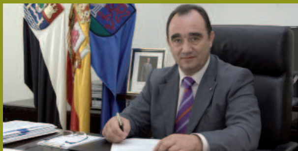
Valentín Cortés Cabanillas Presidente de la Diputación de Badajoz