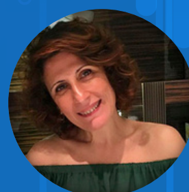
Ascen Moro AJUNT. SANT FELIU DE LLOBREGAT